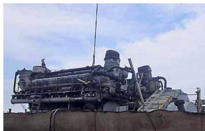
Technische installaties in het binnenste komen bloot.