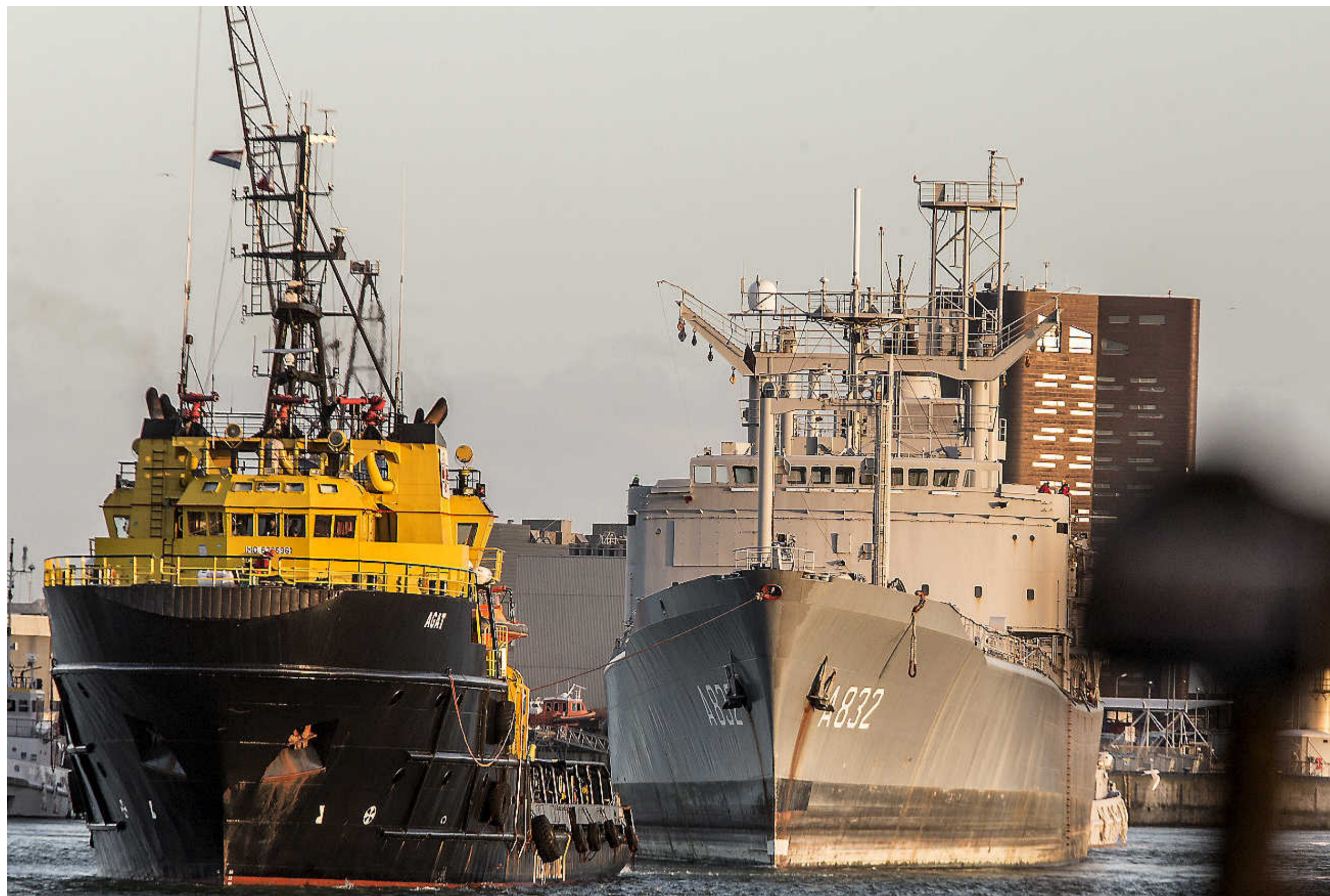
Sleepboot Agat trekt de Zuiderkruis de Helderse marinehaven uit tegen de avond van 21 februari dit jaar.

Het was met bijna veertig jaar het oudste schip van de marine. Nu is de Zuiderkruis gesloopt.