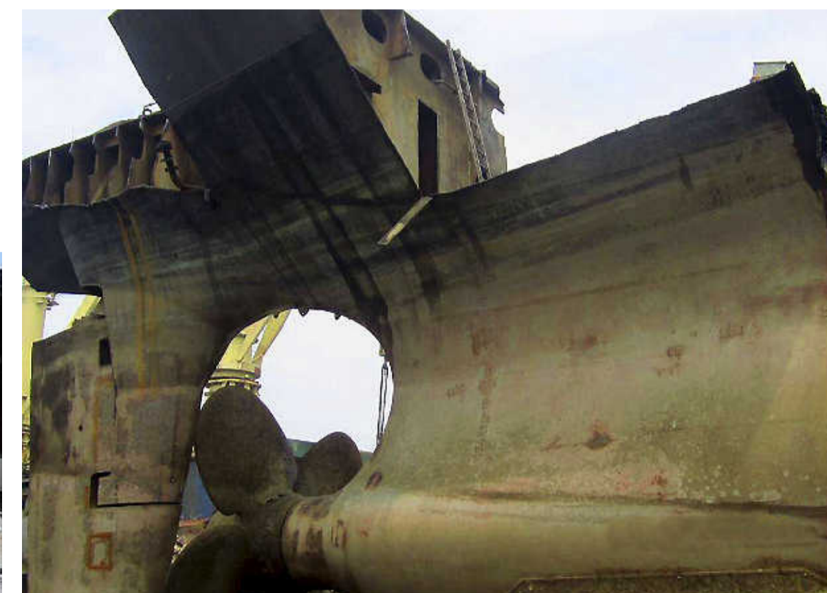
Het roer en de schroef zonder de rest van het schip.