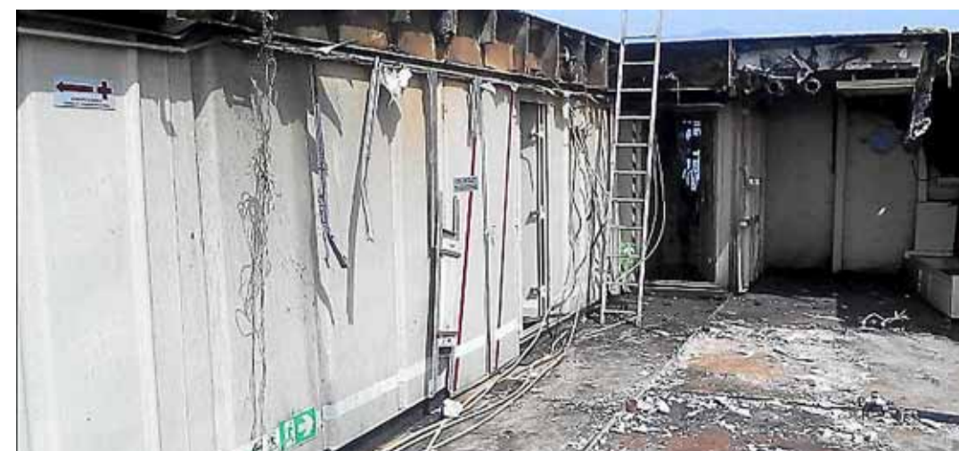
Een gang en deuren. Hoe velen hebben er niet gelopen?