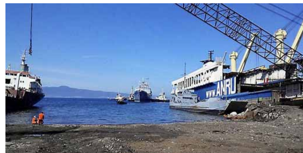
De Zuiderkruis nadert het scheepskerkhof in Turkije eind maart.